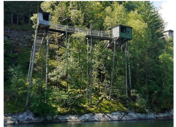
Kvelvingsbru og laksegilje som kulturelement.