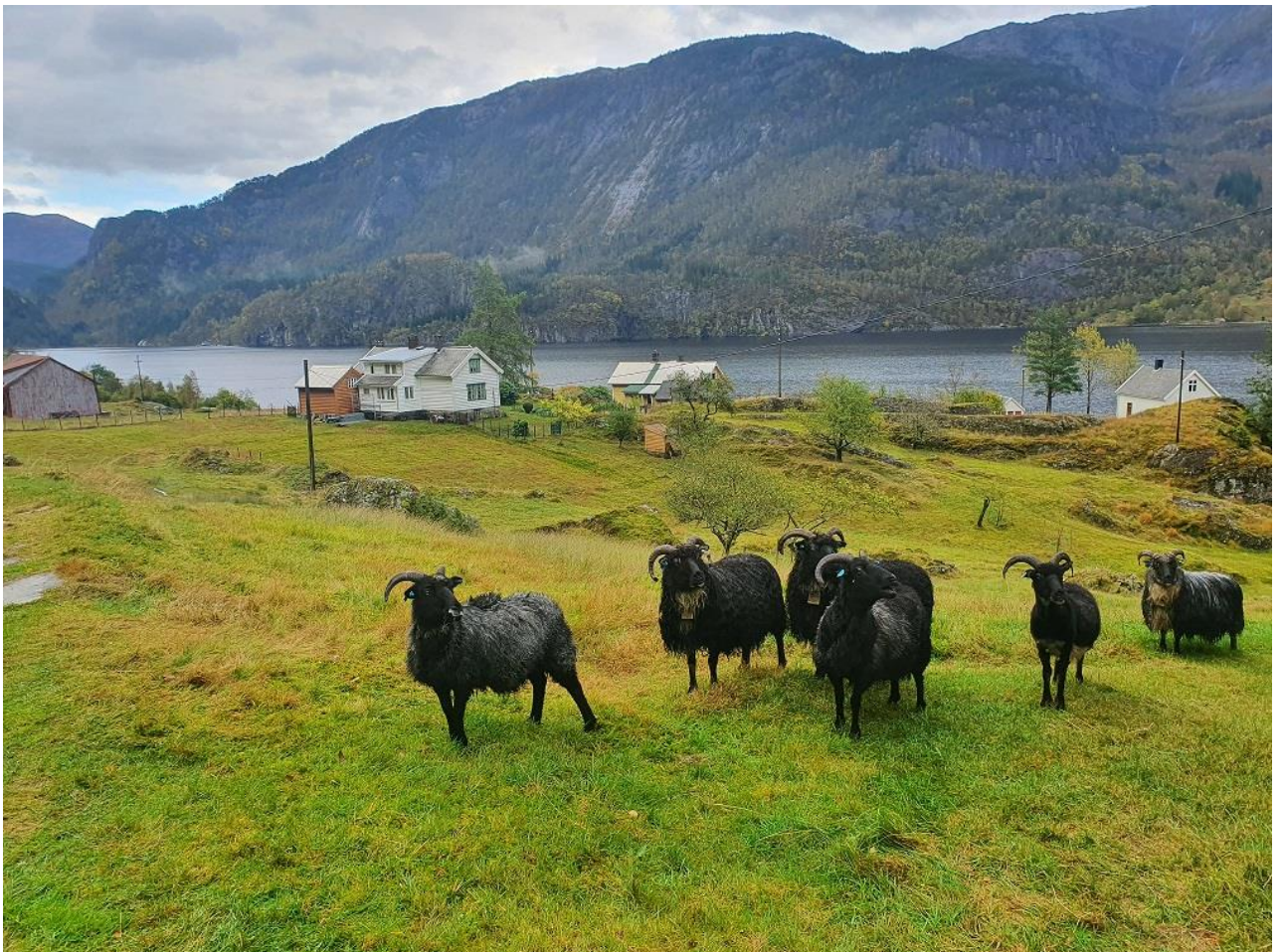
Viktige landskapsleiarar på Bukkestein.