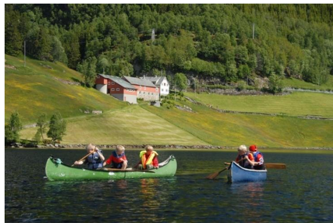
Gode høve på Småbrekke

Kommunen ynskjer å nytte SMIL-midlar til å fremje ferdsle og opplevingar i kulturlandskapet, spesielt gjennom tiltak som kan dempe moglege interesse motsetningar.