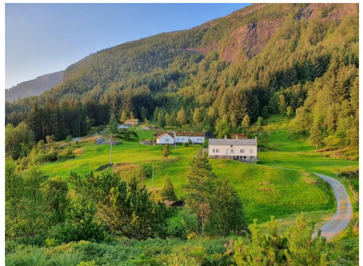
Årleg skjøtsel og slått gjev opne landskap

Aktiv gardsdrift, med slått og beite, er avgjerande for å sikre opne og velstelte kulturlandskap. Nedgangen på areal i drift og talet på beitedyr, skapar difor utfordringar knytt til attgroing av areal. Kommunen ynskjer i dette høvet å prioritere skjøtselstiltak i område som framleis har kulturpreg, for å ta vare på natur- og kulturminneverdiar i jordbruket sitt kulturlandskap. Dette for å sikre og forsterke miljø- og arealkvaliteten, mellom anna med tilretteleggingstiltak som fremjar ulike skjøtselstiltak gjennom praktiske gjeremål. Til dømes ved rydding, inngjerding og liknande. Derimot må ikkje bruken av SMIL-midlar gå til tiltak som vert rekna å inngå i «vanleg jordbruksdrift». Sakshandsamar må i dette høvet gjere ei konkret vurdering frå sak til sak, i høve til regelverket. Gamle driftsmåtar, som hesjing, kan inngå i prioriteringa.